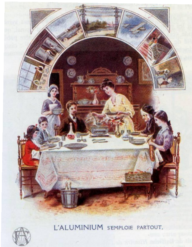
Abb. 3: „Aluminium wird überall verwendet“

Über dem Bild der Familie, die mit Aluminium-Besteck von Tellern aus Aluminium speist und die einen Sektkühler aus Aluminium verwendet, sind im Halbkreis Abbildungen angeordnet, welche die Aluminium-Produktion, Leitungen für die Hochspannungsübertragung und Aluminium-Verwendung im Flugzeug- und Automobilbau darstellen.