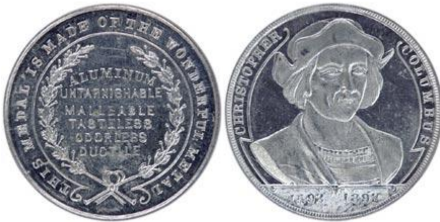
Abb. 2: Aus Aluminium geprägte Medaillen von der „World’s Columbian Exhibition“ in Chicago (1893). Text der Inschrift: THIS MEDAL IS MADE OF THE WONDERFUL METAL – ALUMINUM – UNTARNISHABLE – MALLEABLE – TASTELESS – ODORLESS – DUCTILE; (Fotos courtesy of Tom Hoffman). (Quelle: http://www.so-calleddollars.com/Events/Worlds_Columbian_Expo.html )

Auch die mehr als dreißig Jahre später abgehaltene „World’s Columbian Exhibition“ in Chicago drückt diese hohe Wertschätzung für dieses Material aus, wie eine aus Aluminium geprägte Medaille deutlich macht (Abb. 2).