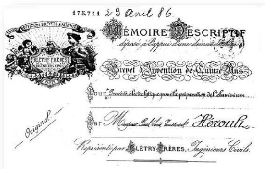
Abb. 1: Das im April 1886 Paul Héroult erteilte französische Patent „Brevet d’Invention“.

Die ab 1860 zunächst verwendeten chemischen Herstellungsverfahren (Bourgarit 2005) wurden bald durch die elektrolytische Produktion abgelöst, für welche Charles Hall in den USA wie auch Paul Héroult in Frankreich 1886 Patente erhielten (Abb. 1). Dabei wird durch hohe elektrische Ströme das im Aluminiumoxid „Alumina“ ( \text{Al}_2\text{O}_3 ) enthaltene Aluminium herausgelöst. Dies erfolgt in einem Bad von geschmolzenem „Kryolit“, einer Natrium-Aluminium-Fluorid-Verbindung ( \text{Na}_3\text{AlF}_6 ). Die dafür notwendige elektrische Energie wird von – erst in den 1870er Jahren entwickelten – Dynamos geliefert. Die ersten Aluminiumhütten wurden nahe den stromerzeugenden Wasserkraftwerken errichtet – in den alpinen Tälern von Frankreich und der Schweiz (La Praz) sowie später auch nahe den Niagarafällen in den USA. Die Jahresproduktion des ersten französischen Aluminiumwerkes erreichte 1900 bereits mehr als 1.000 t (Hachez-Leroy 2013).