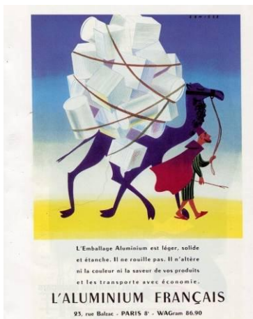
Abb. 5: „Aluminium als Verpackungsmaterial ist leicht, solide und dicht. Es rostet nicht. Es verändert weder die Farbe noch das Aroma ihrer Produkte und es ermöglicht einen kostengünstigen Transport“.

Neben Dosen haben sich auch Aluminiumfolien sowohl für die Verpackung von vorbereiteten Mahlzeiten, wie auch für die Verpackung im Haushaltsbereich durchgesetzt und die Produktion nimmt jährlich um etwa 4 % weiter zu. Alleine in Europa wurden 2012 mehr als 209.000 t Aluminiumfolie hergestellt. 9 Insgesamt ist der Verpackungsbereich ein sehr bedeutender Sektor der Aluminium-Verwendung, in den fast 20 % der gesamten Produktion fließen (Das 2007).