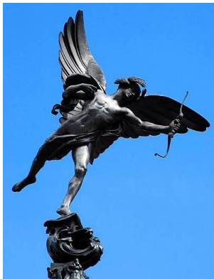
Abb. 4: Aluminiumguss: „Anteros“, der Zwillingbruder von Eros und Sohn von Ares und Aphrodite. Statue von Alfred Gilbert (1893), Shaftesbury Memorial am Picadilly Circus, London.

Die zuerst verwendeten Verfahren zur Herstellung von metallischen Objekten waren – vor mehr als 100 Jahren – Gussprozesse . Dadurch wurden dekorative Artikel, Schmuckembleme für die französische Armee sowie auch Kochutensilien hergestellt. Und sowohl die Statue des „Anteros“, die 1893 in London aufgestellt wurde (Abb. 4), als auch die zuvor, 1884, installierte metallene Spitze des Washington Monuments in den USA (mit einem Gewicht von 2,8 kg, als Aluminium noch ebenso teuer war wie Silber) wurde aus Aluminiumguss geformt (Binczewski 1995).