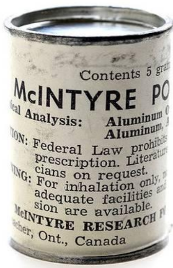
Abb. 6: „Tin Can of Fine Aluminum Oxide McIntyre Powder Used To Protect Ontario Miners From Silicosis“

Im Zeitraum zwischen 1944 und 1979 erhielten Arbeiter von zahlreichen kanadischen Untertage-Bergbaubetrieben auf Anordnung der Firmenleitungen zu Beginn jeder Schicht etwa zehn Inhalationen von Feinstäuben aus Aluminium und Aluminiumoxid. Diese Stäube wurden mit einer speziell entwickelten Pulvermühle hergestellt und mit einem Inhalationsapparat als feinverteilter Alu-Staub bereitgestellt; das Herstellungsverfahren dieses sogenannten „McIntyre Powders“ (Abb. 6) wurde in zwei U.S. Patenten beschrieben (N° 2,156,378 und N° 2,837,451). In späteren Untersuchungen (Rifat 1990) wurden nachträglich die Mengen der auf diese Weise verabreichten Aluminiumpulver-Aerosole mit ca. 375 mg je Arbeiter und Jahr abgeschätzt.